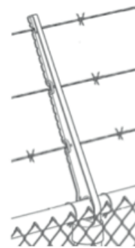
Support de fil incliné